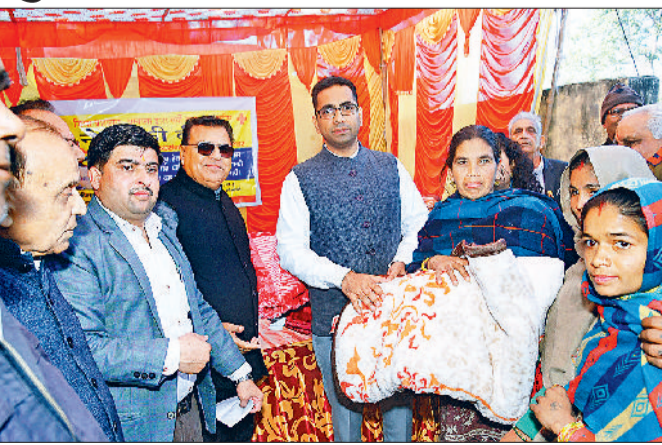
अंबाला। जरूरतमंद लोगों को गर्म कपड़े बांटे डीसी डॉ. शालीन।

शुरूआत की गई है। उन्होंने सभी दानी सज्जनों से अपील की कि वे इस मुहियम में अपना योगदान दें। आमजन भी यदि अपनी इच्छा से सहयोग देना चाहते हैं तो वे भी