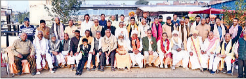
थानेसर। गौशाला महासंघ द्वारा आयोजित कार्यक्रम में भाग लेते गौशालाओं के प्रतिनिधि।