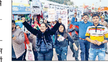
द्वार बच्चों ने सभी को सिखाया कि हमें सब सबको मिल जुलकर रहना चाहिए। ट्रस्ट के सदस्यों ने स्टॉल नंबर 613 से लेकर सावित्री घाट तक पैदल जागरूकता यात्रा निकाली। यात्रा में ट्रस्ट

अंतरराष्ट्रीय गीता महोत्सव के दौरान रविवार को सतयुग दर्शन ट्रस्ट के सदस्यों ने पैदल जागरूकता यात्रा निकाली। यात्रा में शामिल ट्रस्ट के सदस्यों ने मानव धर्म को अपनाने हुए श्रेष्ठ बनने का संदेश दिया। इस दौरान सतयुग दर्शन ट्रस्ट के बच्चों ने सांस्कृतिक प्रस्तुति दी। प्रस्तुति