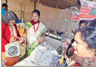
कुरुक्षेत्र। अंतरराष्ट्रीय गीता महोत्सव में असम पवेलियन में बनाए गए मंच पर असम के कलाकारों ने जनजातीय तीवा नृत्य की प्रस्तुति दी और असम की सांस्कृतिक विरासत को सहेजने का भरपूर प्रयास किया इस पवेलियन में हरियाणावी लोगों ने असम के नृत्य को खूब सराहा।