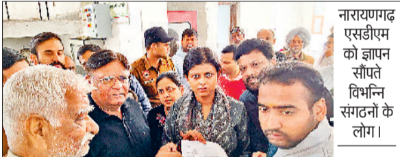
नारायणगढ़ एसडीएम को ज्ञापन सौंपते विभिन्न संगठनों के लोग।

भगवान श्री राम की नगरी अयोध्या में 22 जनवरी 2024 को एक भव्य समारोह का आयोजन प्रस्तावित है। इस दिन भगवान राम अपने नवनिर्मित मंदिर में प्राण प्रतिष्ठा किया जाएगा। इस पर क्षेत्रवासियों की मांग है इस दिन शराब मांस मदिरा इत्यादि पर पाबंदी रहे। इसको लेकर सरकार के सभी नागरिक एकमत हो सोमवार सुबह 11 बजे रेस्ट हाउस में एकत्रित हुए इसमें बार