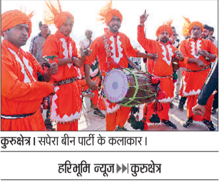
कुरुक्षेत्र। संपरा बीन पार्टी के कलाकार।