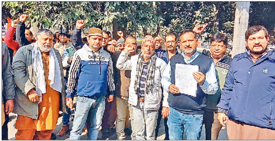
यमुनानगर। यमुनानगर के सब्जी आढ़ती एसोसिएशन के सदस्य अपनी मांगों को लेकर मार्केट कमेटी के कार्यालय के समक्ष प्रदर्शन करने के दौरान मुख्यमंत्री के नाम कमेटी के सचिव को सौपा जाने वाले ज्ञापन की प्रतियों को दिखाते हुए।

सब्जी मंडी आढ़ती एसोसिएशन के सदस्यों ने सरकार द्वारा एक मुश्त मार्केट फीस जमा कराने को लेकर जारी की गई अधिसूचना के विरोध में सोमवार को मार्केट कमेटी के कार्यालय के समक्ष प्रदर्शन किया। मौके पर प्रदर्शनकारियों ने अधिसूचना वापस लिए जाने की मांग को लेकर मुख्यमंत्री के नाम मार्केट कमेटी के सचिव को ज्ञापन सौपा। इस दौरान सब्जी मंडी आढ़तियों ने सरकार पर 20 नुक